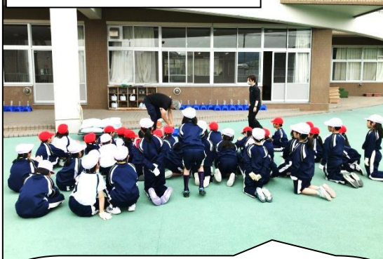
5月15日 さみさと小学校

子供たちからの質問 (Q=質問) Q：どうやって、植えるのですか？ Q：水は、いつやればいいのか？ Q：肥料は、何をやればいいのか？ (アサガオの栽培に使った鉢に植えている)