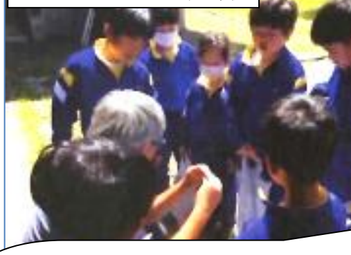
5月17日 あさひ野小学校

子供たちからの質問 (Q=質問) Q：どうやって、植えるのですか？ Q：水は、いつやればいいのか？ Q：肥料は、何をやればいいのか？ (アサガオの栽培に使った鉢に植えている)