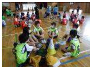
交流大会：チーム打合せ