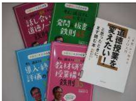
加藤 宣行 著