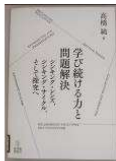
高橋 純 著